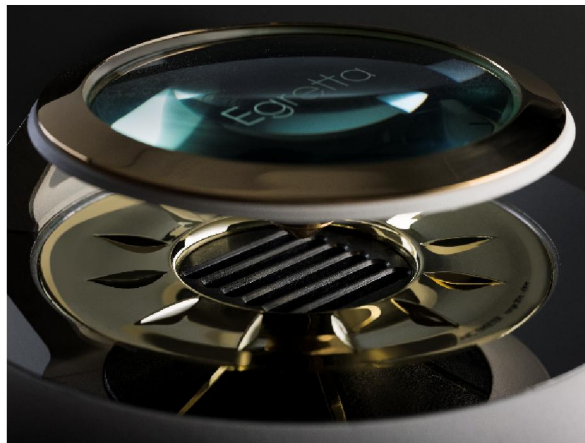
ハイルドライバー トゥイーター部