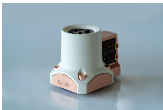
製品名：OCT BEAT 型式：MA70 小型ステレオアンプ